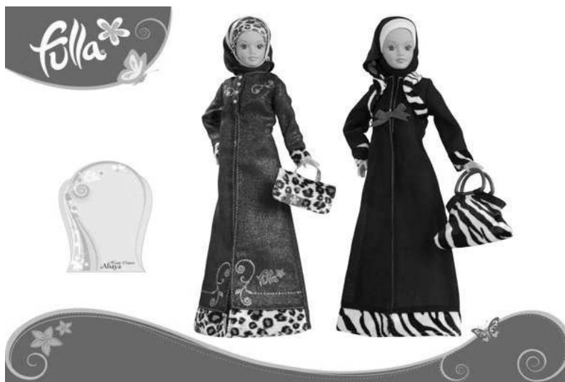
Fotografia 3,4. Lalki Fulla w różnych odsłonach